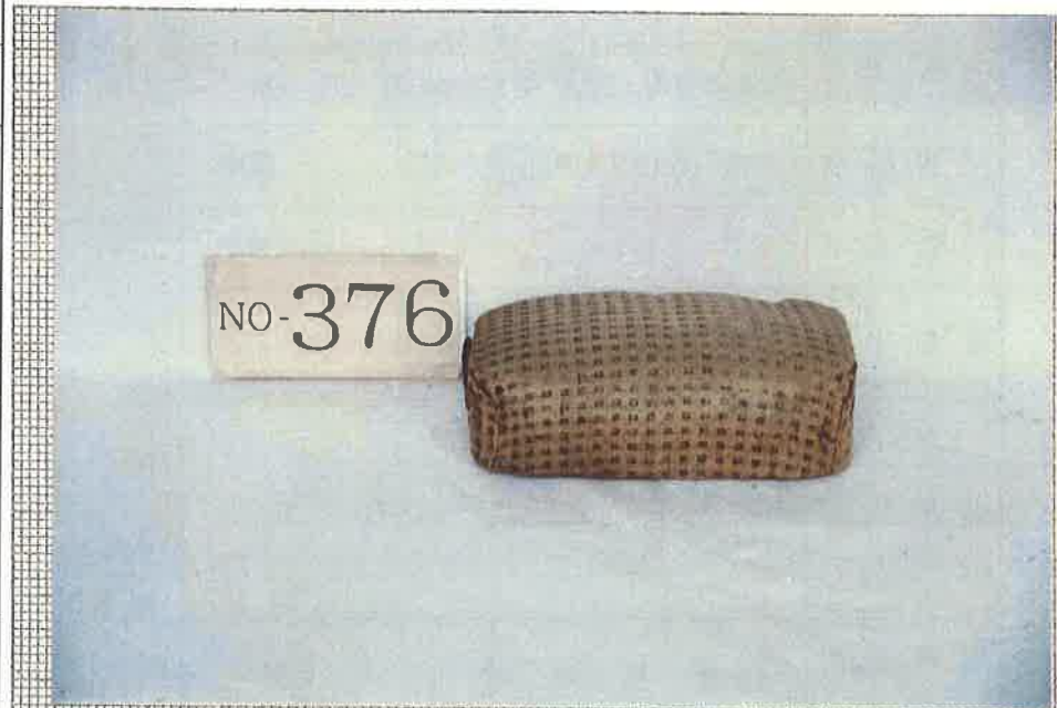
写真・形状・寸法等