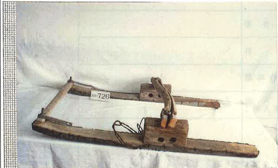
写真・形状・寸法等