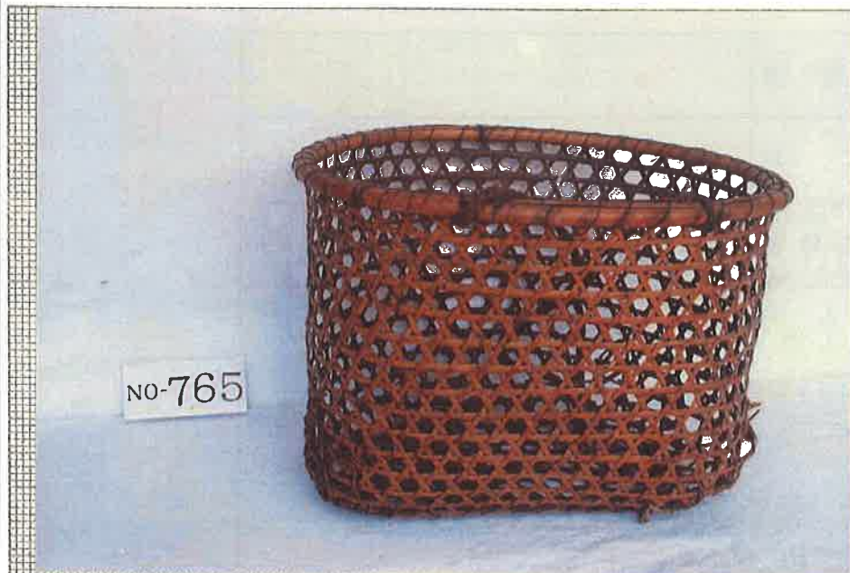
写真・形状・寸法等