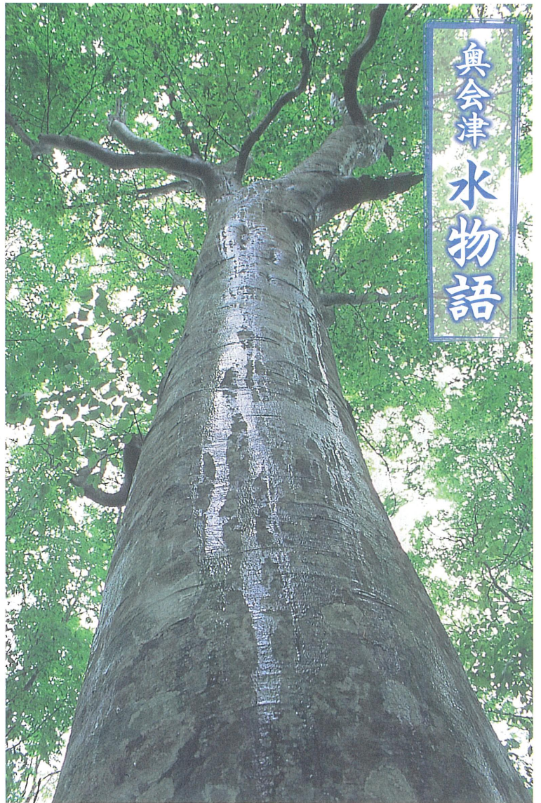
ブナは雨水の通り道。広げた葉が雨を集めて幹を伝い足元に蓄える。ブナの樹肌を濡らす水は、天然ダムの源流である。