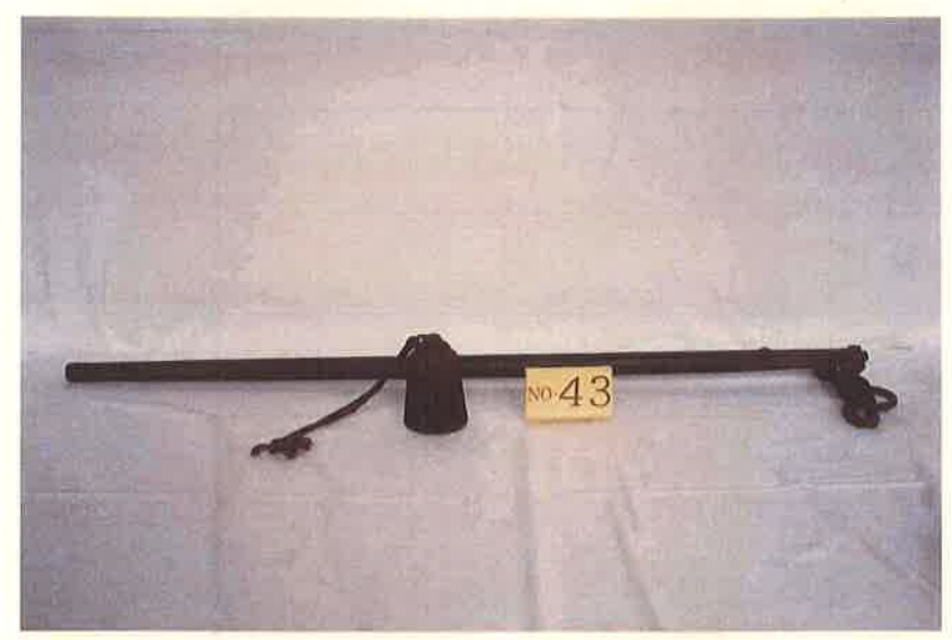
写真・形状・寸法等