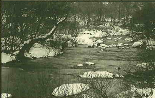
撮影地: 館岩村