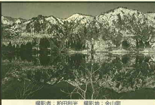
撮影地: 金山町