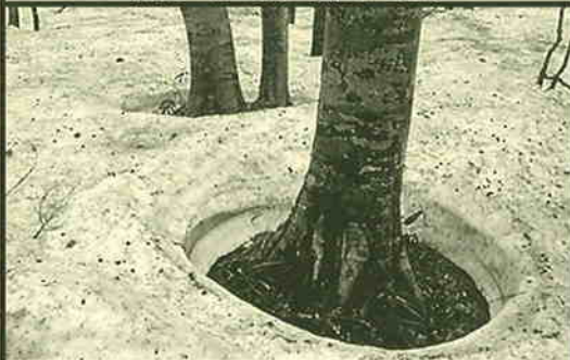
撮影地: 檜枝岐村