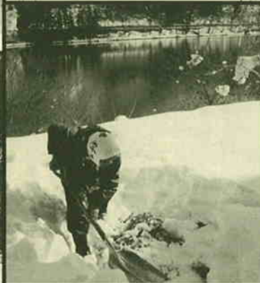
撮影地: 柳津町