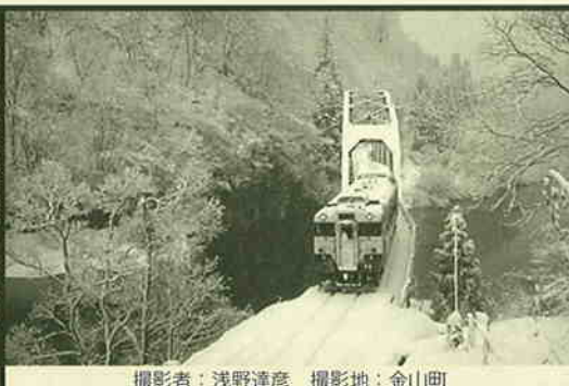
撮影者: 浅野達彦 撮影地: 金山町