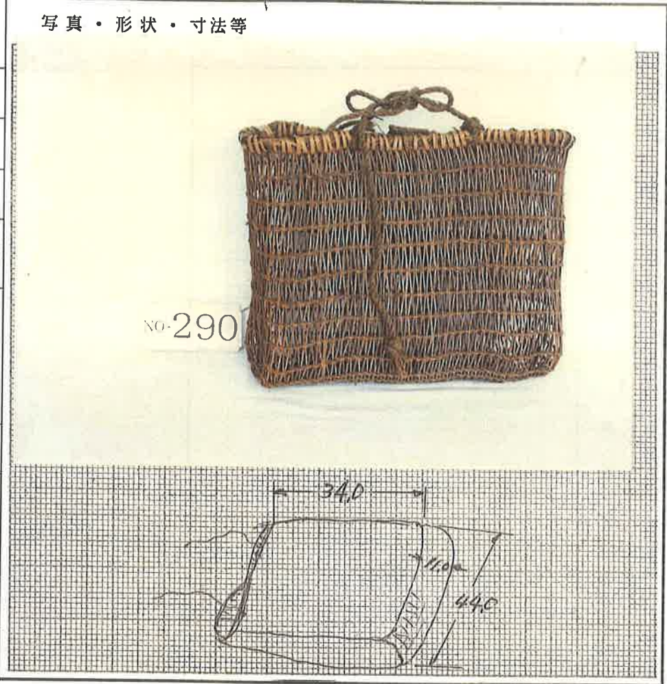
写真・形状・寸法等