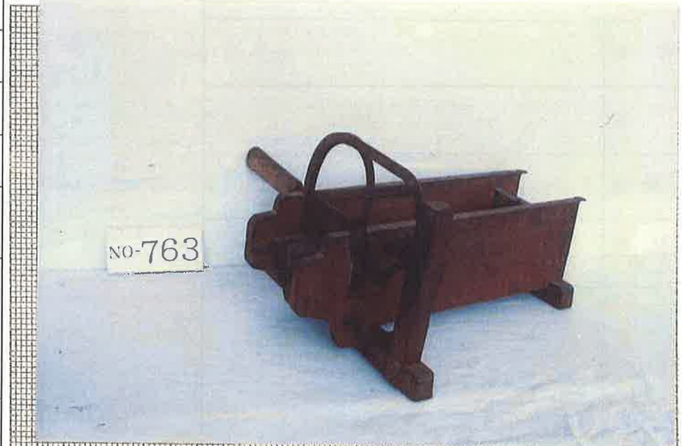
写真・形状・寸法等