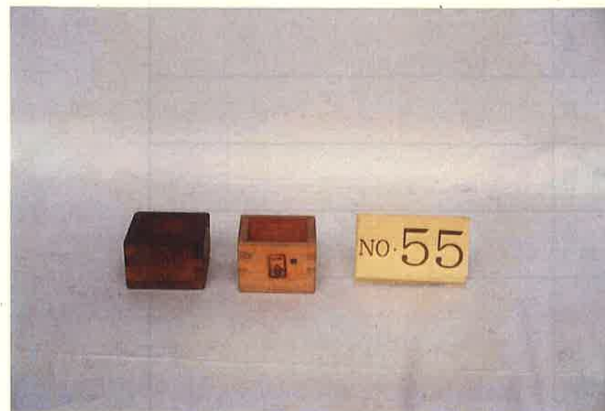
写真・形状・寸法等