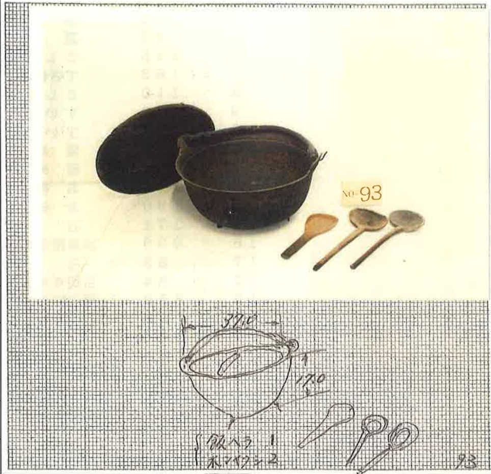
写真・形状・寸法等