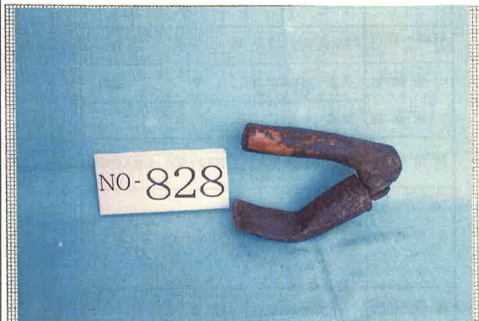
写真・形状・寸法等