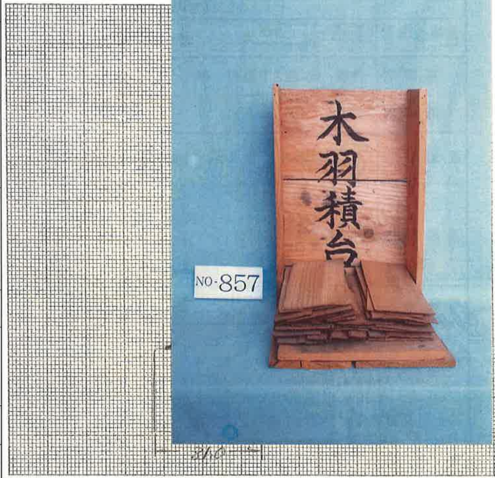
写真・形状・寸法