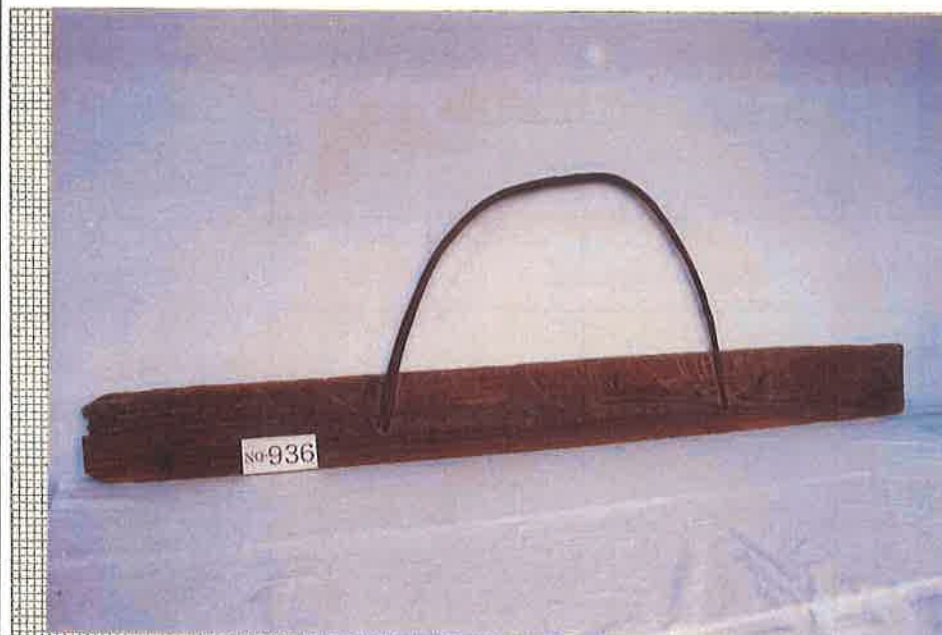
写真・形状・寸法等