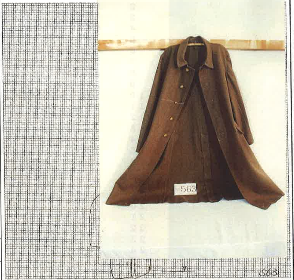
写真・形状・寸法