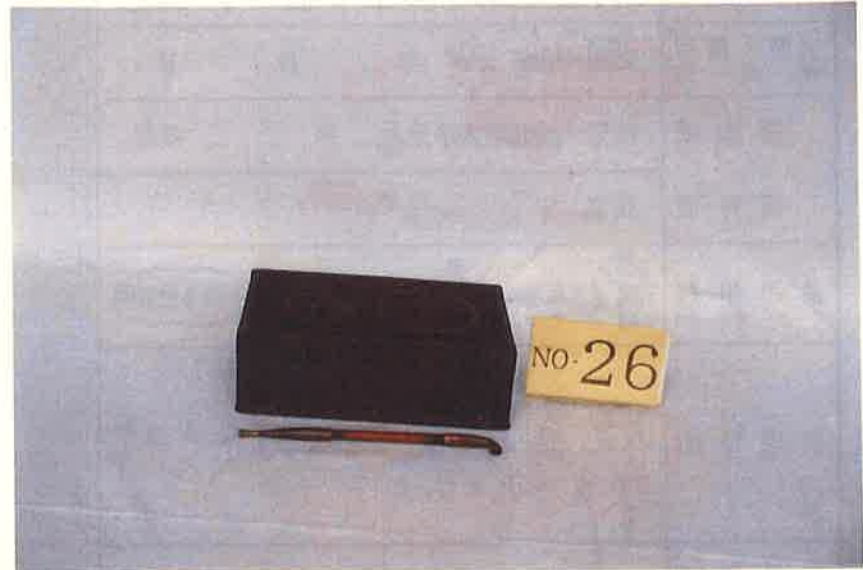
写真・形状・寸法等