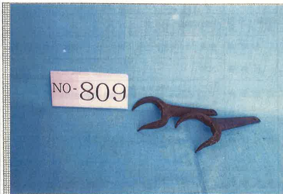
写真・形状・寸法等