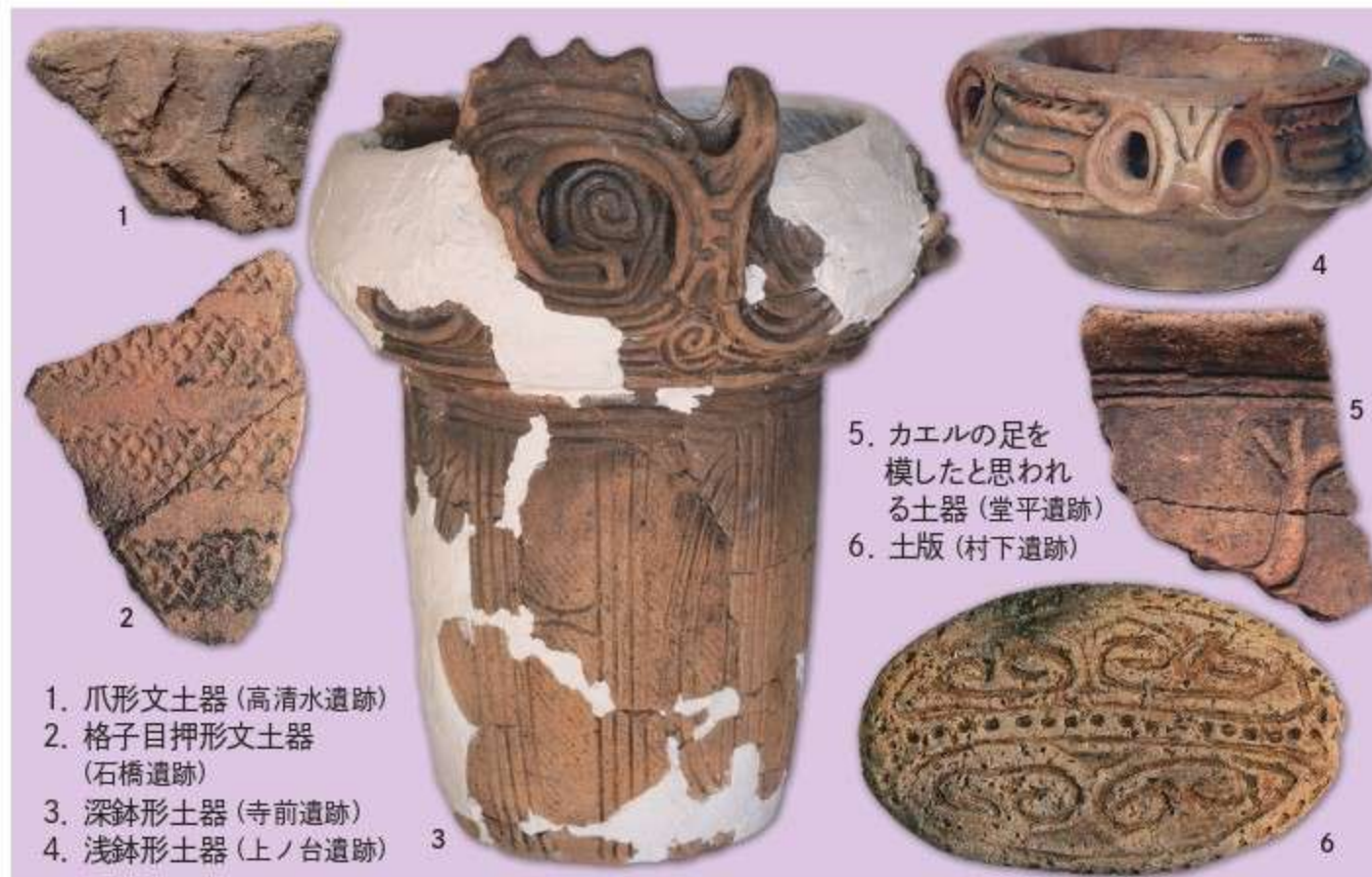
1. 爪形文土器(高清水遺跡) 2. 格子目押形文土器(石橋遺跡) 3. 深鉢形土器(寺前遺跡) 4. 浅鉢形土器(上ノ台遺跡) 5. カエルの足を模したと思われる土器(堂平遺跡) 6. 土版(村下遺跡)

南会津町(伊南・館岩・南郷・田島の各地域)の縄文遺跡の総数は95か所を数えます。その多くが阿賀川、伊南川、館岩川の河川に沿うように立地しています。その中でも数少ない縄文草創期の遺跡が馬乗りばんば遺跡・高清水遺跡で、奥会津最古の爪形文土器が出土しています。縄文早期の石橋遺跡からは押型文土器、奥会津を代表する縄文中期の寺前遺跡・上ノ台遺跡、そして縄文中期・晩期の村下遺跡からは多くの土器等が出土しています。写真の寺前遺跡の土器は、新潟の火焔型土器と東北の大木式土器が折衷した会津独特の火焔系土器です。村下遺跡出土の土版は、儀礼や祈りのために用いられたと考えられています。「奥会津の縄文」展では、これらの縄文草創期から晩期にわたる出土品を一覧で紹介し、南会津町の縄文遺跡の特色をくまなく表す内容となっております。