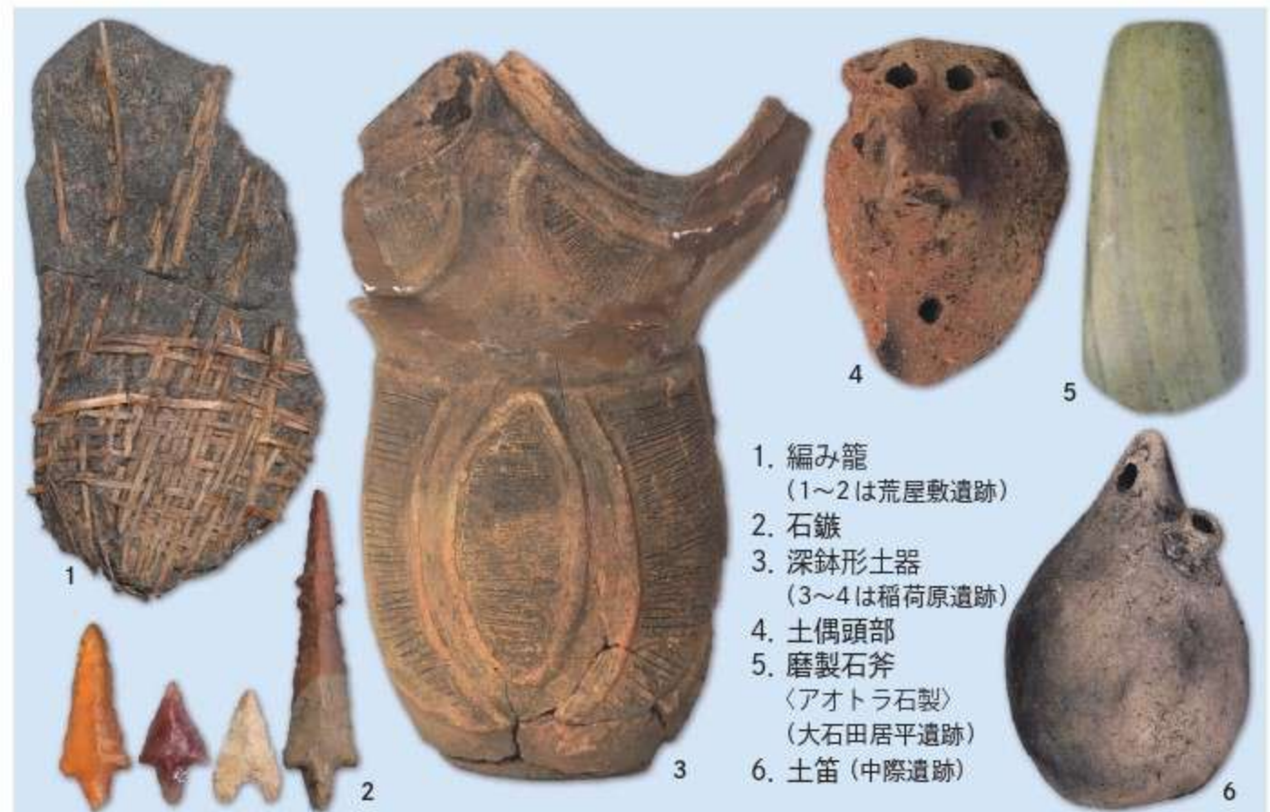
1. 編み籠(1~2は荒屋敷遺跡) 2. 石鏃 3. 深鉢形土器(3~4は稲荷原遺跡) 4. 土偶頭部 5. 磨製石斧(アオトラ石製)(大石田居平遺跡) 6. 土笛(中際遺跡)

三島町の縄文遺跡は19か所が確認されています。そのうち試掘を含め発掘調査が実施された遺跡は8か所で、約5500年前に噴出した沼沢火山起源の堆積物のため、縄文中期以降の遺跡が発見されています。荒屋敷遺跡(縄文晩期)は、低湿地帯にあったことで、遺存しにくい有機質の遺物が多く出土し、主要なものが国の重要文化財に指定されています。展示内容は、荒屋敷遺跡の石製の鏃や斧、刃物といった石器・石製品、ならびに漆塗土偶、漆塗壺、縄、編み籠の複製品、出土した編み組技法を用い再現した編み籠の復元品をはじめ、発掘調査が実施された入間方、佐渡畑、銭森、中際、稲荷原、大石田居平、小和瀬の7遺跡(縄文中期～晩期)の土器・土製品、石器・石製品です。