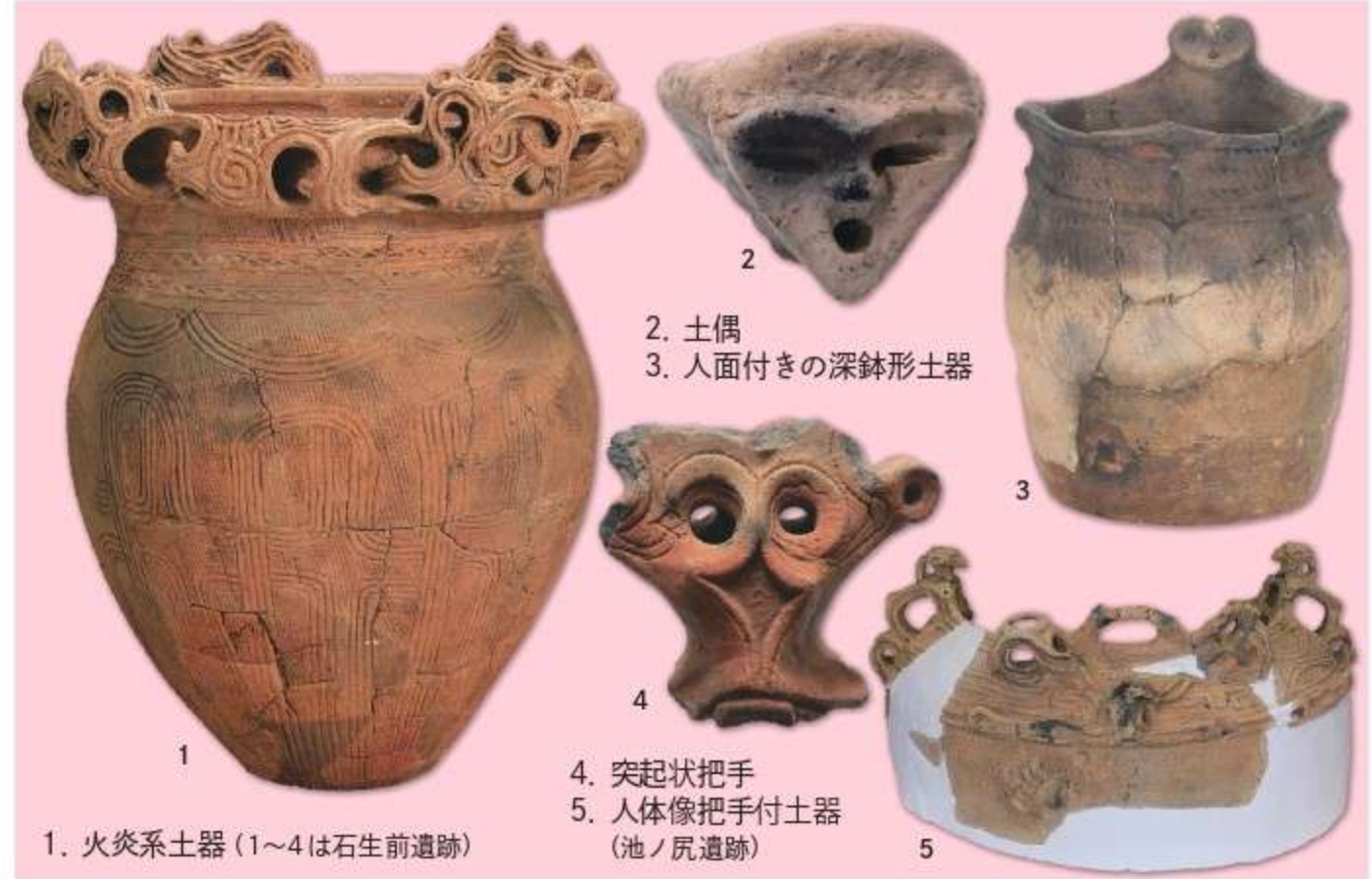
1. 火焔系土器(1~4は石生前遺跡) 2. 土偶 3. 人面付きの深鉢形土器 4. 突起状把手 5. 人体像把手付土器(池ノ尻遺跡)

柳津町には13か所の縄文遺跡が知られています。その代表が石生前遺跡(縄文中期・後期)です。1988年など数回にわたる発掘調査で40棟を超す竪穴住居跡が発見されたほか、大量の土器・石器・土偶などが出土した集落跡です。主な出土品が福島県指定重要文化財となっています。展示品としては石生前遺跡からの出土品が大半を占め、発掘された竪穴住居跡の復元住居、池ノ尻遺跡から出土した人体像把手付土器(現在、奈良市にて修復作業中)の3D画像と関連遺物、そして塩野半在家遺跡・砂子原居平遺跡から出土した遺物(縄文晩期)があります。また、遺物整理の状況を、そのままの姿で見学できるコーナーもあります。