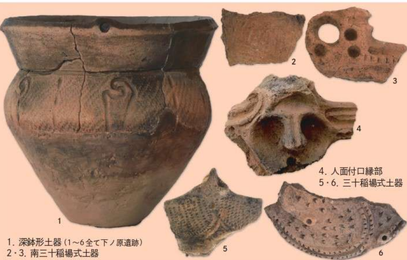
1. 深鉢形土器(1~6全て下ノ原遺跡) 2・3. 南三十稲場式土器 4. 人面付口縁部 5・6. 三十稲場式土器

檜枝岐村の縄文遺跡は、標高900～1000m台の高地に位置することが特徴です。現在までに7か所の遺跡が確認されており、役場周辺にある下ノ原遺跡がその代表です。下ノ原遺跡は河川最上流部では比較的大きな遺跡として知られ、縄文後期の敷石遺構、土器・土偶、石鏃・凹石などの石器が発見されています。写真の深鉢形土器は下ノ原遺跡から出土したもので、檜枝岐村では復元された唯一のもので、口縁部に人面意匠を施した深鉢形土器や、大型のハート形土偶(表紙参照)などは貴重な出土品です。燧岳北麓のブナ平の遺跡や只見川上流部に位置する小沢平遺跡は、新潟県魚沼地方につながるルートの存在を推定させ興味深い遺跡です。檜枝岐村の出土品の多くは未発表であり、この「奥会津の縄文」展が初公開となります。