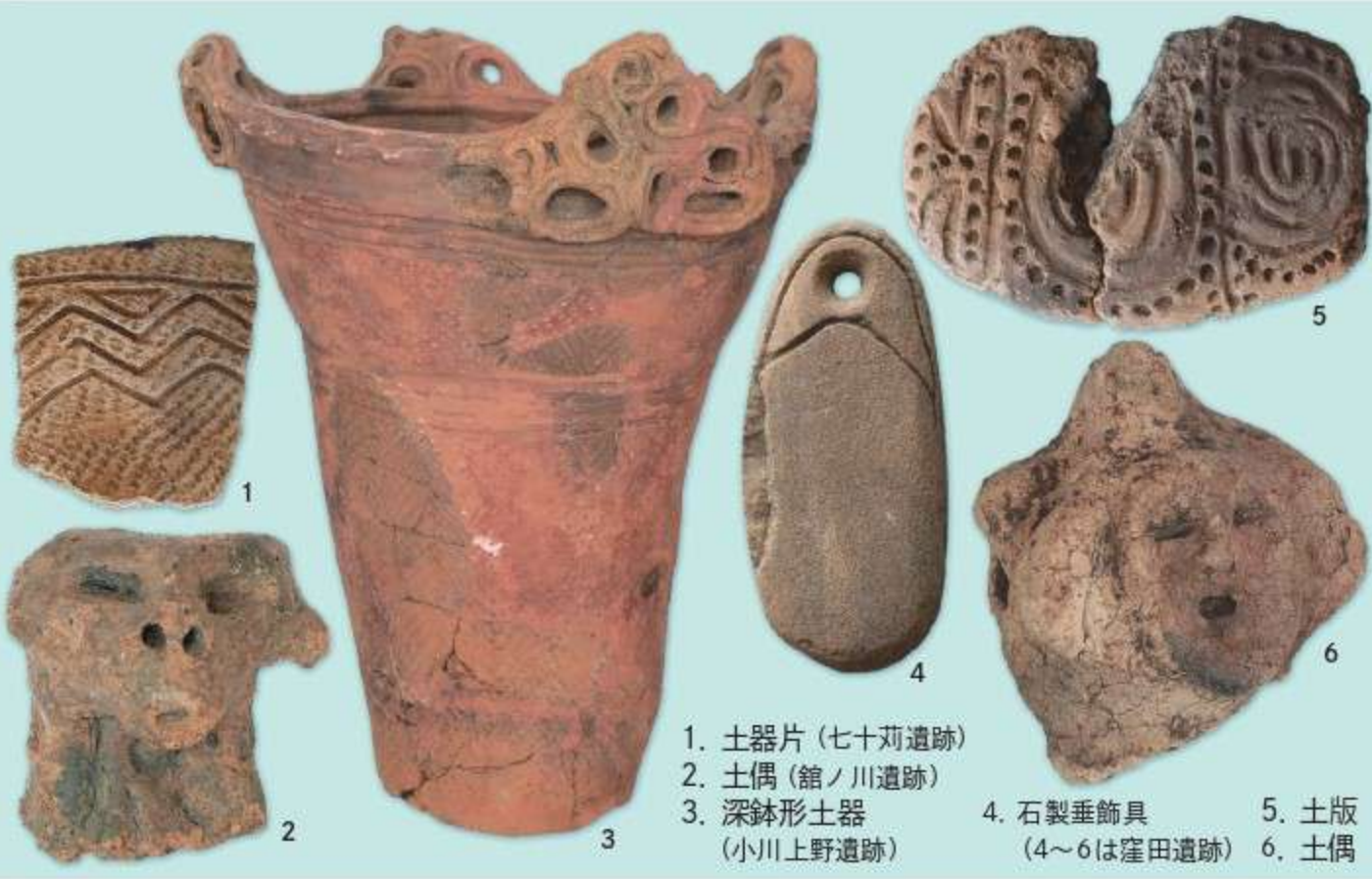
1. 土器片(七十蒔遺跡) 2. 土偶(館ノ川遺跡) 3. 深鉢形土器(小川上野遺跡) 4. 石製垂飾具(4~6は窪田遺跡) 5. 土版(小川上野遺跡) 6. 土偶

只見町における縄文時代の遺跡は、31か所が確認されています。そのほとんどは縄文中期から晩期にかけての遺跡です。代表的な遺跡は、岩下遺跡(二軒在家)、外出遺跡(小林)、七十蒔遺跡(小林)、窪田遺跡(大倉)、小川上野遺跡(小川)、館ノ川遺跡(楡戸)などがあげられます(カッコ内は大字名)。「奥会津の縄文」展が開かれる「ただみ・モノとくらしのミュージアム」の遺跡ひろばは、福島県指定史跡の窪田遺跡です。また、縄文の復元住居もご覧いただけます。「奥会津の縄文」展では、窪田遺跡から土偶、土錘・石錘、耳飾り、土版など、また館ノ川遺跡の土偶、小川上野遺跡・岩下遺跡の深鉢形土器など、只見町を代表する出土品を紹介します。