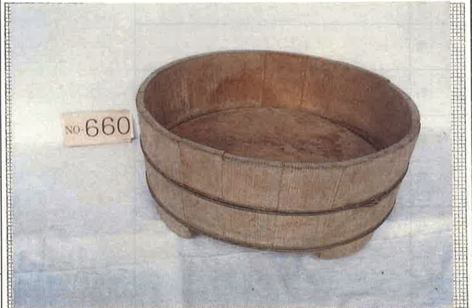
写真・形状・寸法等