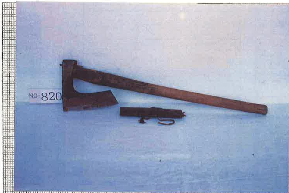
写真・形状・寸法等