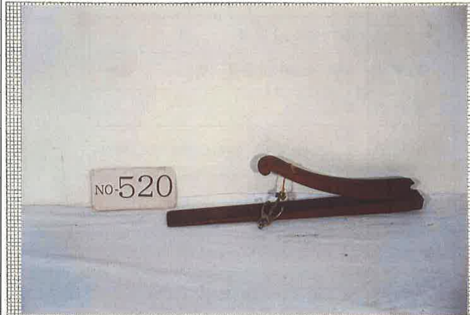
写真・形状・寸法等