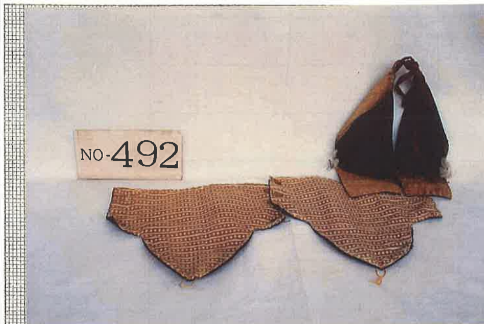
写真・形状・寸法等