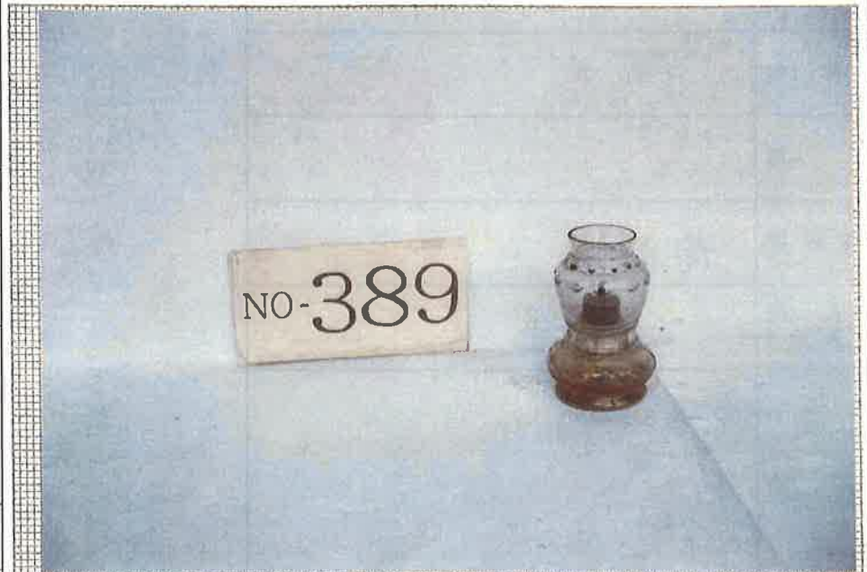
写真・形状・寸法等