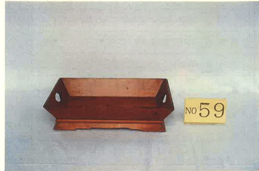
写真・形状・寸法等