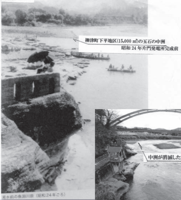
柳津町下平地区(15,000 m)の玉石の中洲 昭和24年片門発電所完成前