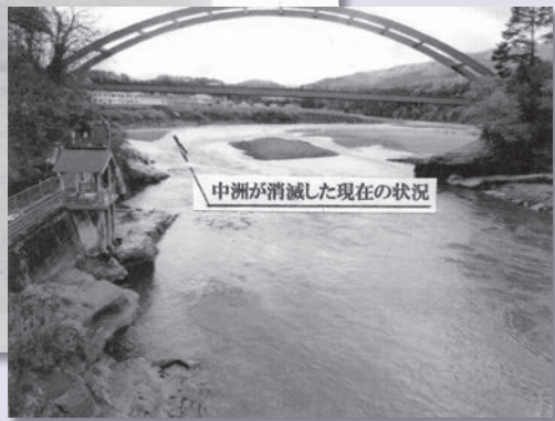
中洲が消滅した現在の状況