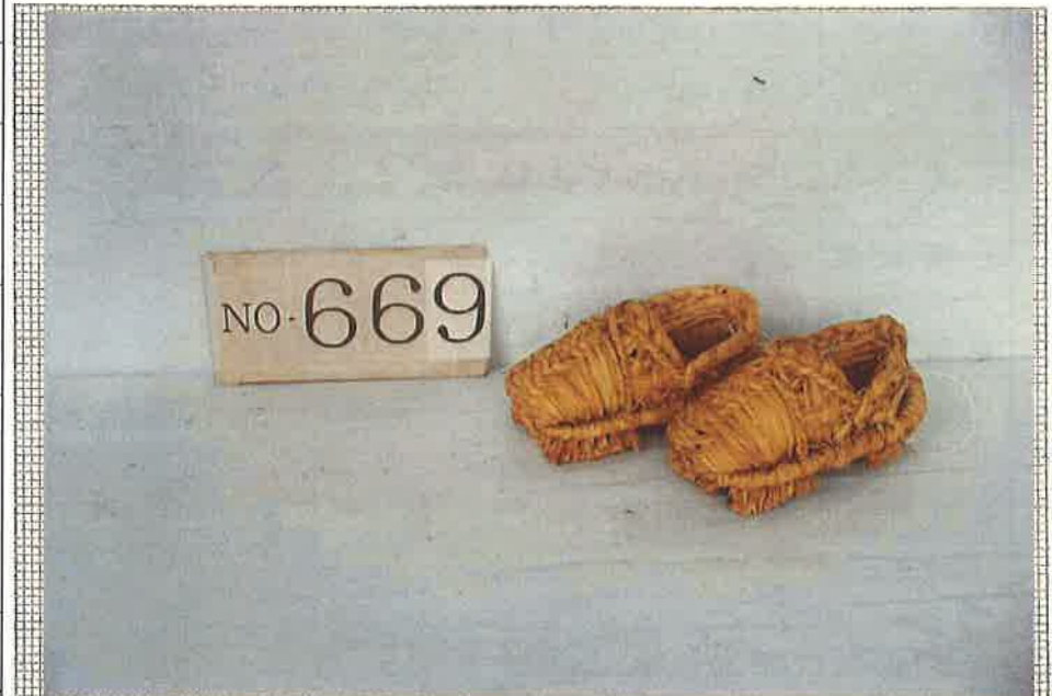
写真・形状・寸法等