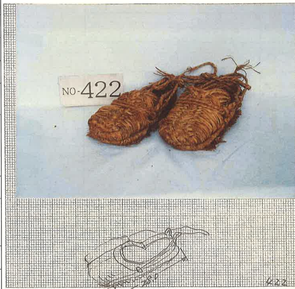
写真・形状・寸法等